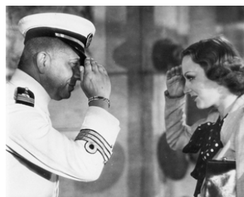
1940 MACAO, L'ENFER DU JEU de Jean Delannoy avec Mireille Balin