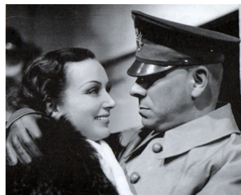
1938 RAPPEL IMMÉDIAT de Léon Mathot avec Mireille Balin