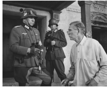
1943 L'ÉTOILE DU NORD (The North Star) de Lewis Milestone avec Walter Huston