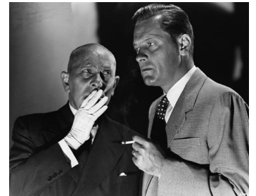
1950 BOULEVARD DU CRÉPUSCULE (Sunset Boulevard) de Billy Wilder avec William Holden