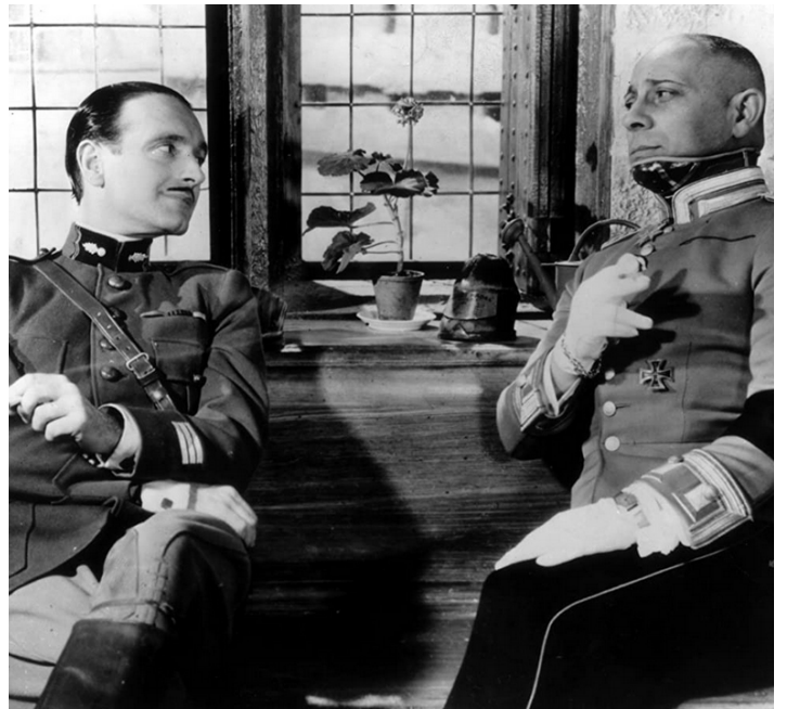
1937 LA GRANDE ILLUSION de Jean Renoir avec Pierre Fresnay