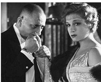
1931 LE SPHINX A PARLÉ (Friends and Lovers) de Victor Schertzinger avec Lili Damita