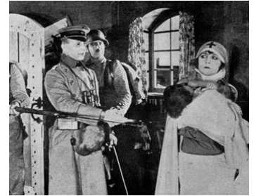
1918 POUR L'HUMANITÉ (Hearts of Humanity) d'Allen Hollubar avec Dorothy Phillips