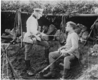
1918 LE SCEPTIQUE (The Unbeliever) d'Alan Crosland avec Raymond McKee