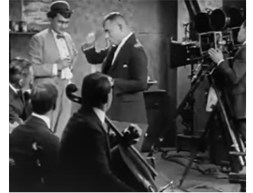
1923 ÂMES À VENDRE (Souls for Sale) de Rupert Hughes avec Jean Hersholt