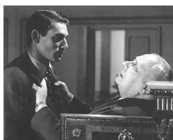
1954 SÉRIE NOIRE de Pierre Foucaud avec Robert Hossein