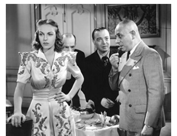
1940 TANYA L'AVENTURIÈRE (I was an Adventuress) de Gregory Ratoff avec Peter Lorre, Vera Zorina