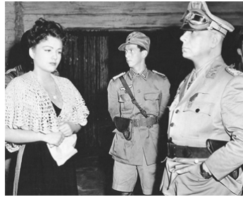
1943 LES 5 SECRETS DU DÉSERT (Five graves to Cairo) de Billy Wilder avec Anne Baxter