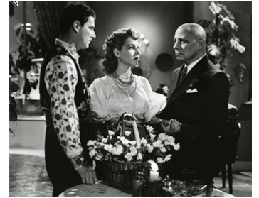
1945 LE MASQUE DE DIJON (The Mask of Dijon) de Lew Landers avec W. Wright, Jeanne Bates