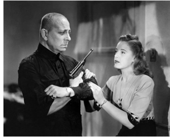
1945 LA CIBLE VIVANTE (The great Flamaron) d'Anthony Mann avec Mary Beth Hughes