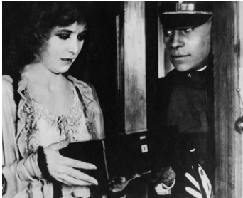
1919 LA LOI DES MONTAGNES (Blind Husbands) d'Erich von Stroheim avec Francelia Billington