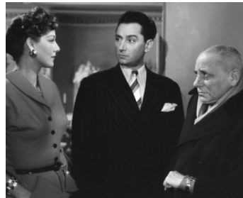
1949 PORTRAIT D'UN ASSASSIN de Bernard-Roland avec Maria Mauban, Pierre Brasseur