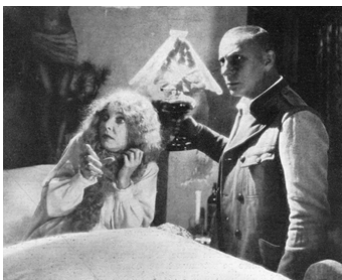
1930 LUNE DE MIEL (The Honeymoon) d'Erich von Stroheim avec ZaSu Pitts