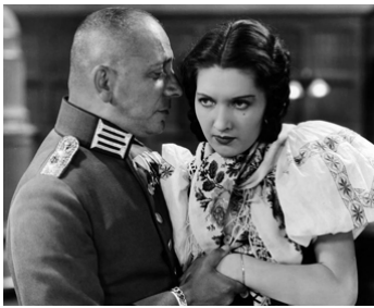
1934 POSTE FRONTIÈRE (Fugitive Road) de Frank R. Strayer avec Wera Engels