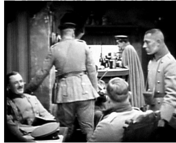
1918 LES CŒURS DU MONDE (Hearts of the World) de David Wark Griffith