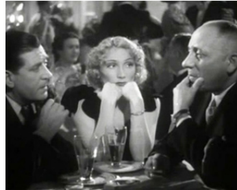
1937 L'ALIBI de Pierre Chenal avec Albert Préjean, Jany Holt