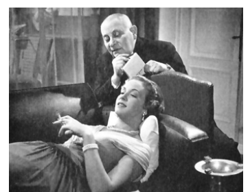
1955 LA MADONE DES SLEEPINGS d'Henri Diamant-Berger avec Giselle Pascal