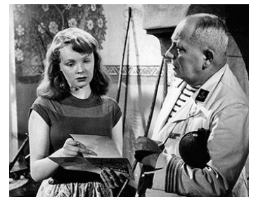
1952 L'ENVERS DU PARADIS d'Edmond T. Gréville avec Dora Doll