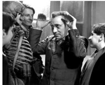
1938 LES DISPARUS DE SAINT-AGIL de Christian-Jaque avec Serge Grave, Marcel Mouloudji