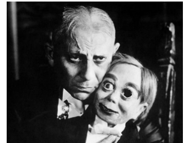
1929 GABBO LE VENTRILOQUE (The great Gabbo) de James Cruze