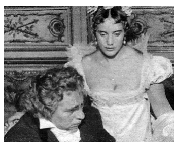
1955 NAPOLÉON de Sacha Guitry avec Maria Schell