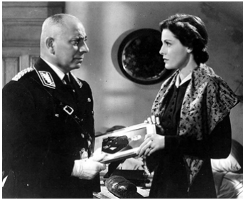
1941 AINSI FINIT NOTRE NUIT (So ends our Night) de John Cromwell avec Frances Dee