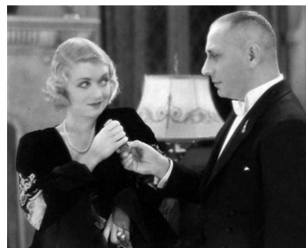
1930 AGENT ZI (Three Faces east) de Roy Del Ruth avec Constance Bennett