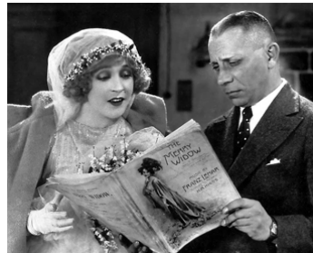
1925 LA VEUVE JOYEUSE (The merry Widow) d'Erich von Stroheim avec Mae Murray