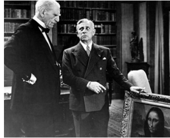
1945 UNE ENQUÊTE À SCOTLAND YARD (Scotland Yard investigator) de G. Blair avec C. Aubrey Smith