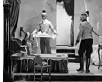
1922 CHEVAUX DE BOIS (Merry-go-round) de Rupert Julian avec Norman Kerry