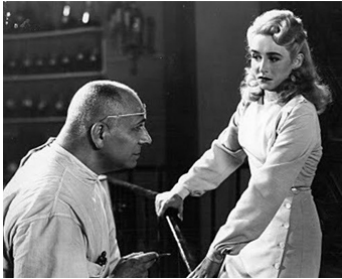
1944 LE CERVEAU DE DONOVAN (The Lady and the Monster) de G. Sherman avec Vera Ralston