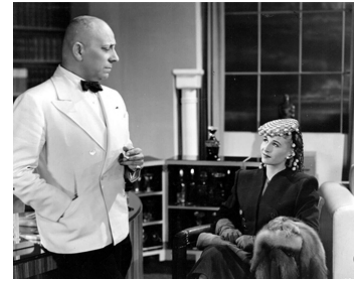
1944 TEMPÊTE SUR LISBONNE (Storm over Lisbon) de George Sherman avec Vera Ralston