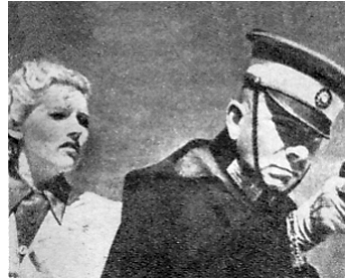
1937 LES PIRATES DU RAIL de Christian-Jaque avec Simone Renant