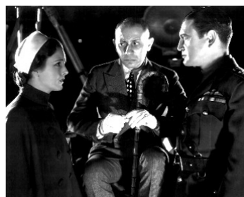
1931 QUATRE DE L'AVIATION (The lost Squadron) de G. Archainbaud avec Mary Astor, R. Dix