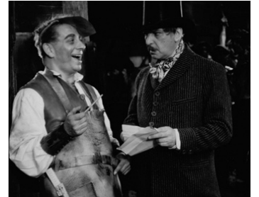
1937 L'AFFAIRE LAFARGE de Pierre Chenal avec Pierre Renoir