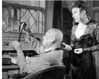
1946 ON NE MEURT PAS COMME ÇA de Jean Boyer avec Denise Vernac