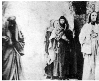
1916 INTOLÉRANCE (Intolerance) de David Wark Griffith avec Howard Gaye (fig.)