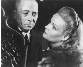
1946 LA FOIRE AUX CHIMÈRES de Pierre Chenal avec Madeleine Sologne