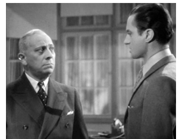
1939 LE MONDE TREMBLERA de Richard Pottier avec Claude Dauphin