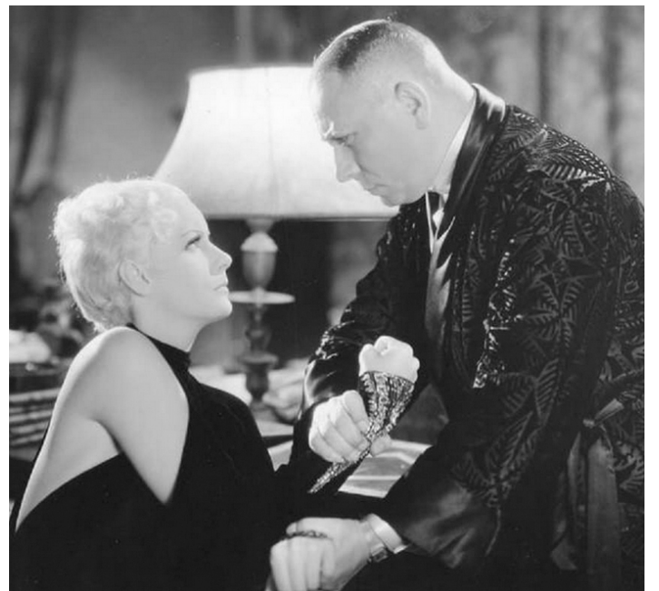
1932 COMME TU ME VEUX (As you desire me) de George Fitzmaurice avec Greta Garbo