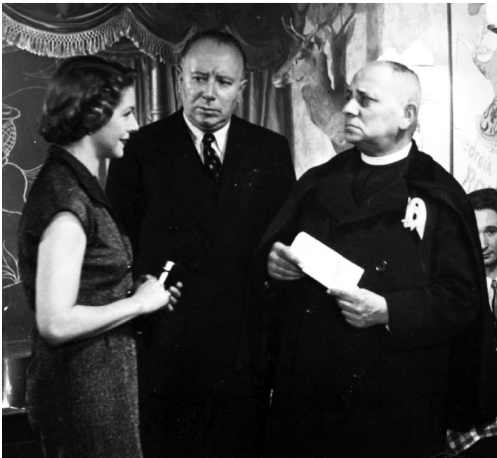
1951 MINUIT, QUAI DE BERCY de Christian Stengel avec Madeleine Robinson, Louis Seigner