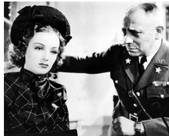
1938 ULTIMATUM (Ultimatum) de Robert Wiene avec Dita Parlo