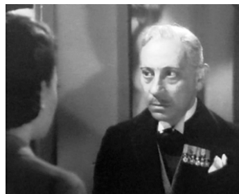
1939 PIÈGES de Robert Siodmak avec Marie Déa