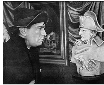
1917 DOUGLAS DANS LA LUNE (Reaching for the Moon) de John Emerson