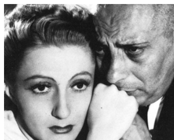
1939 TEMPÊTE de Bernard-Deschamps avec Annie Ducaux