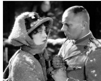
1927 LA MARCHÉ NUPTIALE (The Wedding March) d'E. von Stroheim avec Fay Wray