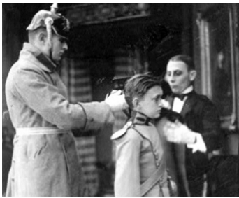
1915 VIEIL HEIDELBERG (Old Heidelberg) de John Emerson avec Francis Carpenter