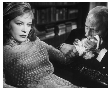
1952 MANDRÉGORE (Alraune) d'Arthur-Maria Rabenalt avec Hildegard Knef