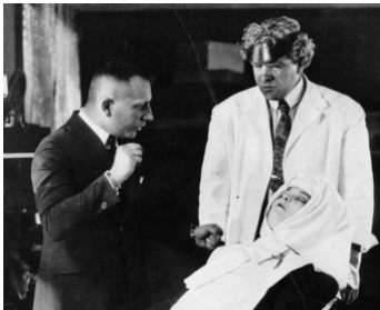
1924 LES RAPACES (Greed) d'Erich von Stroheim avec ZaSu Pitts, Gibson Gowland