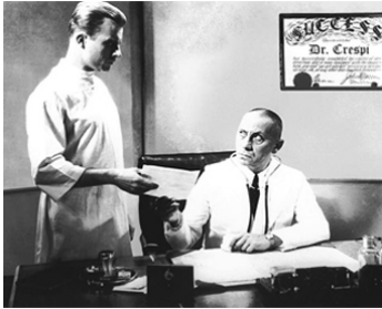
1935 LE CRIME DU DOCTEUR CRESPI (The Crime of Dr Crespi) de John H. Auer avec Dwight Frye