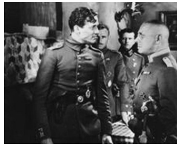
1934 DU SANG DANS LE CIEL (Crimson Romance) de David Howard avec Ben Lyon