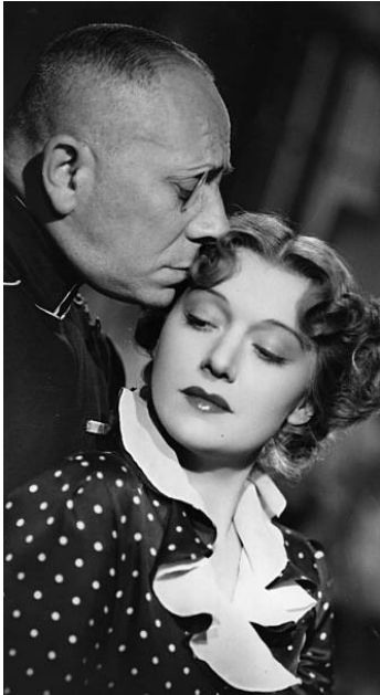
1937 MARTHE RICHARD de Raymond Bernard avec Edwige Feuillère